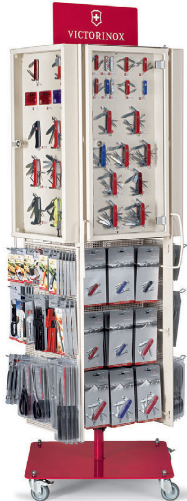
Rotating Display Tower