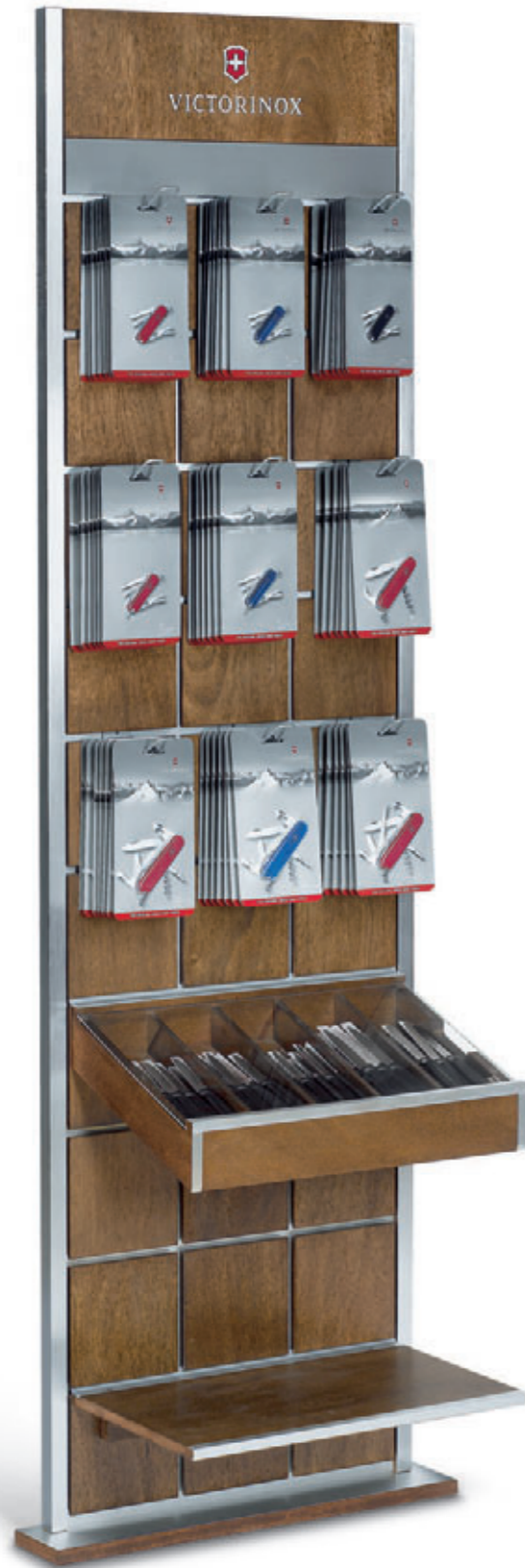
Cutlery / Pocket Tools wall element