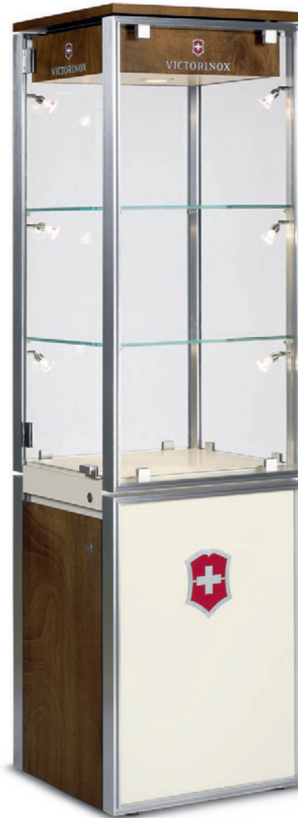
9.5140.1 / 9.5140.2