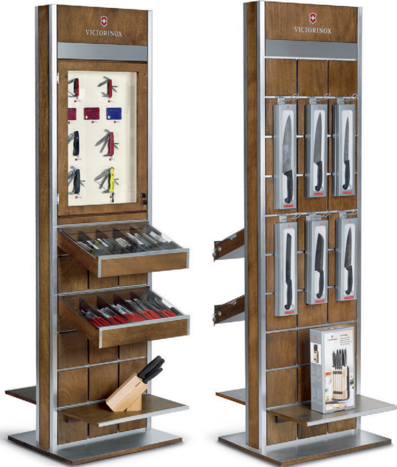
Cutlery / Pocket Tools freestanding Tower