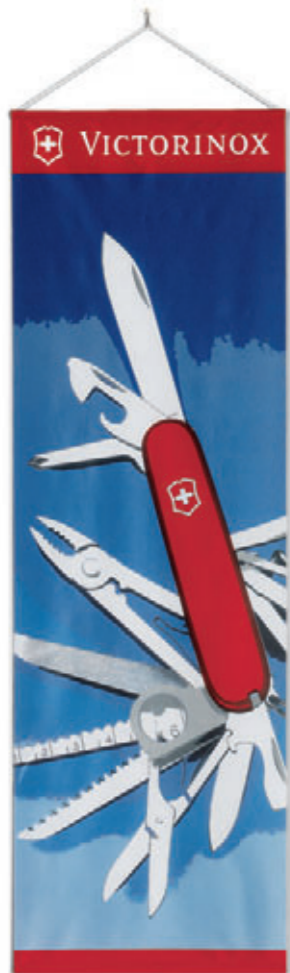
9.6006 / 9.6010