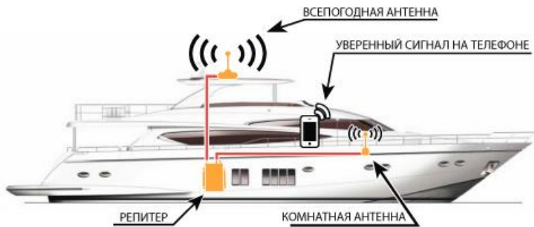
Схема №2. Пример установки системы усиления сотового сигнала на яхте.

Для наглядной проверки качества электромагнитной развязки проделайте следующую последовательность действий: