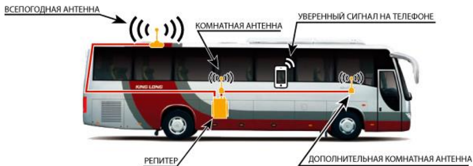
Схема №1. Пример установки репитера в автобусе.

Репитер представляет собой высокочувствительный двунаправленный СВЧ-усилитель сотового сигнала, поэтому при его установке нужно, чтобы всепогодная и комнатные антенны были хорошо изолированы друг от друга и не возникло самовозбуждения репитера. Чтобы наглядном примере понять, что такое самовозбуждение, возьмите, к примеру, микрофон и громкоговоритель и поднесите их близко друг к другу – вы услышите очень сильный шум. Репитер будет работать бесперебойно только в том случае, если электромагнитная развязка будет достаточной для устойчивой работы системы усиления сотового сигнала.