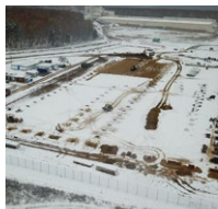
Земляные работы по сооружению фундаментов колонн