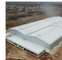
Строительство инженерных сетей