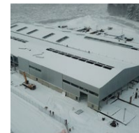
Возведение стен АБК и внутренних встроенных помещений