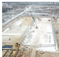
Возведение колонн здания