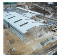
Монтаж стеновых панелей и элементов крыши