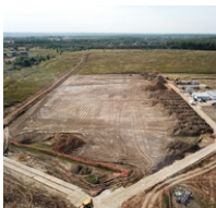
Подготовка строительной площадки