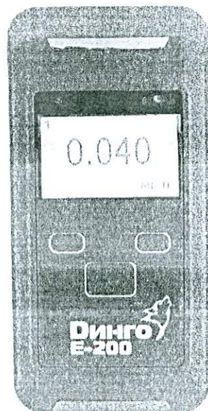
Рисунок 1 - Общий вид анализатора с принтером

Общий вид анализаторов и пример распечатанного протокола измерения представлен на рисунках 1-2.