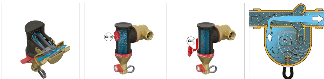
Selection table for Flamcovent & Clean Smart series