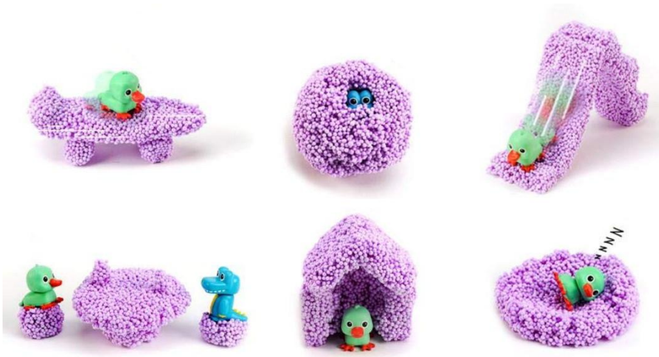
Домики и горки для маленьких фигурок