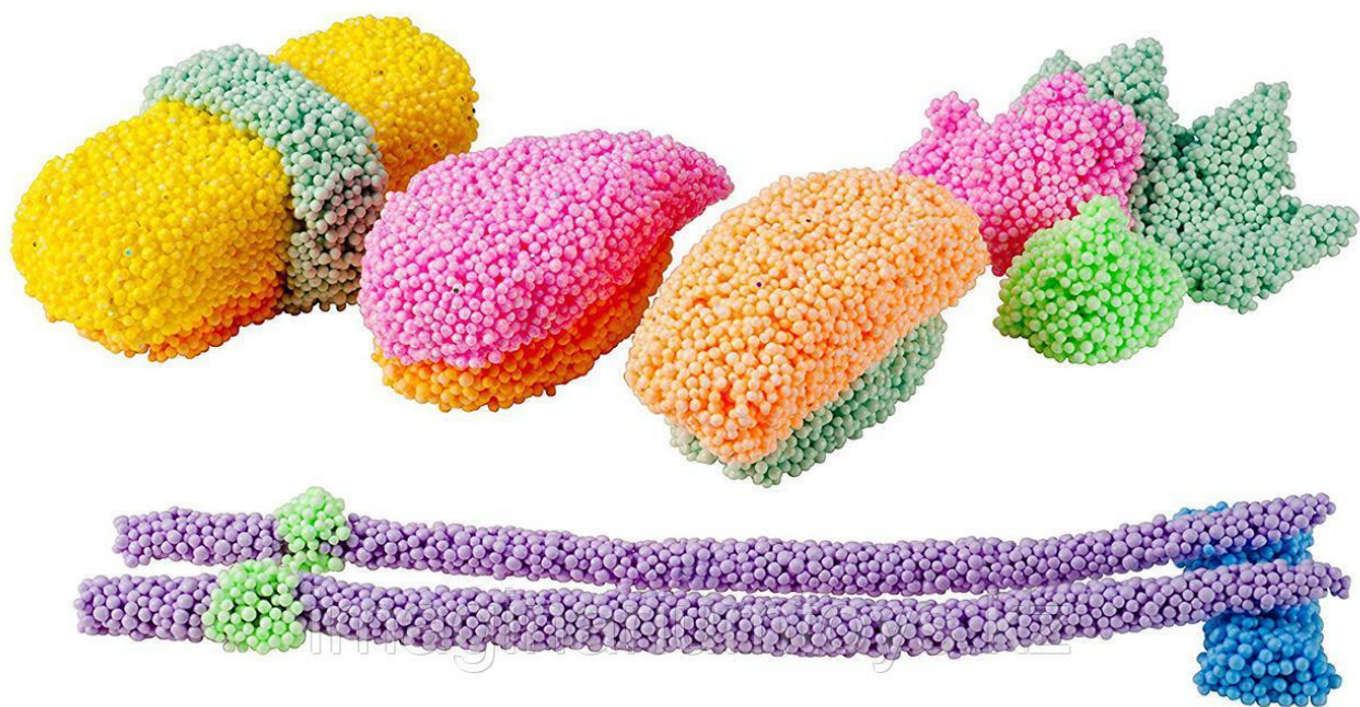
Роллы и суши