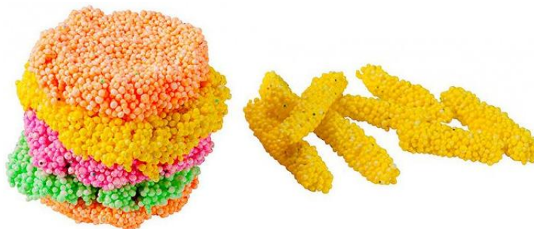
Бургер с картошкой фри