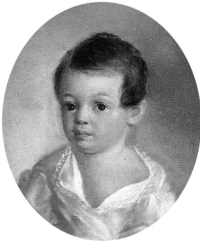
Маленький Саша Пушкин. Худ. Ксавье де Местр, 1800–1802 годы

Дворец Апраксиных на Покровке, известный как «дом-комод», помнит подрастающего Пушкина. Сегодня этот чудом сохранившийся дворец, переживший московский пожар 1812 года, является совершенно необычным памятником русской архитектуры в стиле позднего барокко второй половины XVIII века. Александр Пушкин бывал здесь на «уроках танцевания».