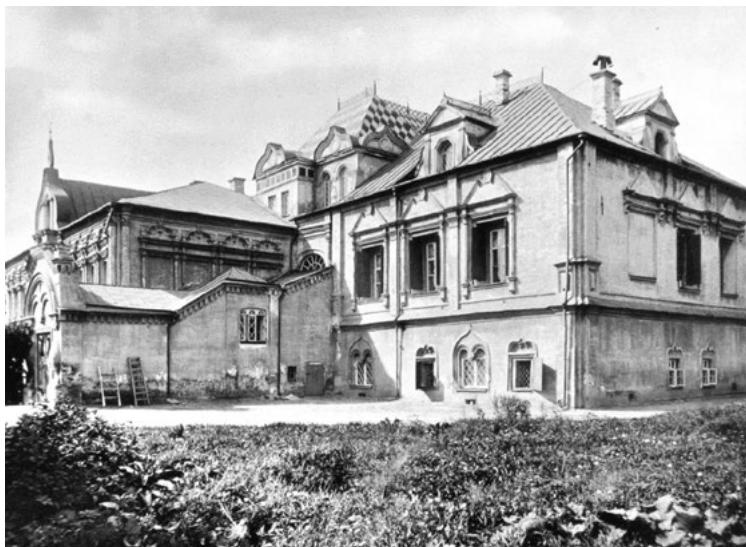
Дворец Юсуповых. XIX век

Дворец Юсуповых – старейшее на сегодняшний день московское здание, связанное с жизнью Пушкина. В основе дворца – палаты XVI–XVII века. Существующее ныне строение сформировалось в результате неоднократных реконструкций и перестроек из двух первоначально самостоятельных корпусов – восточного со столовой палатой и западного. К сожалению, о том, как они выглядели, остались