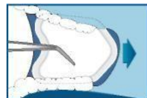
заостренным концом кзади

Через несколько секунд NeoDryS™ приклеивается к щеке и остается на месте. Важно: чтобы удалить NeoDryS™, не раздражая слизистую, ослабьте его адгезию водой из пюстера со щечной стороны.