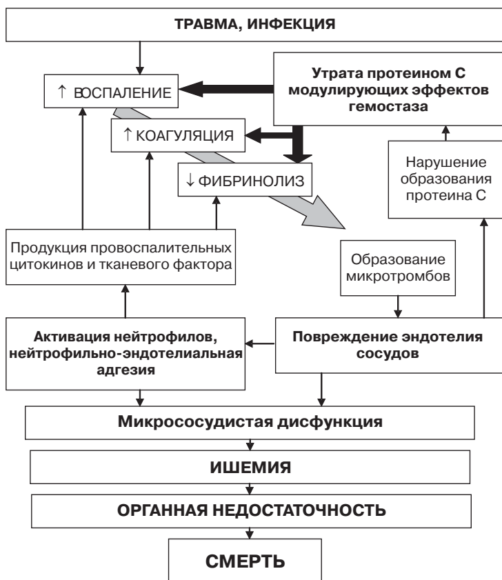
Рис. 2. Патогенез сепсиса в свете новой парадигмы.

Новая парадигма, радикально меняющая взгляды на патофизиологию сепсиса, рассматривает нарушения гомеостаза как неконтролируемый каскад изменений в системах коагуляции, фибринолиза и воспаления, которые происходят одновременно, как цикл автоматического наложения взаимообусловленных процессов с последующим повреждением эндотелия сосудов, микрососудистой дисфункцией, ишемией, органной недостаточностью и вероятностью леталь-