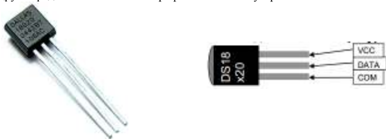
Рис.1 Общий вид изделия и распиновка

Набор представляет собой комплект из двух цифровых датчиков температуры типа DS18B20+ и дополнительных компонентов, которые могут понадобиться при их практическом применении. Набор рекомендован для совместного использования с такими устройствами как GSM интеллектуальное управляющее и охранное устройство «Гардиан» BM8039 или BM8039D в качестве дополнительных датчиков 8-канального микропроцессорного термостата BM8036 и в других радиолюбительских и профессиональных устройствах.