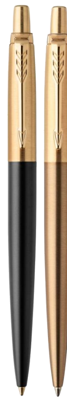
Люкс 2 отделки