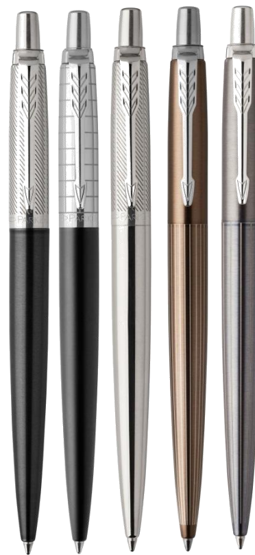
Премиальный 5 отделок