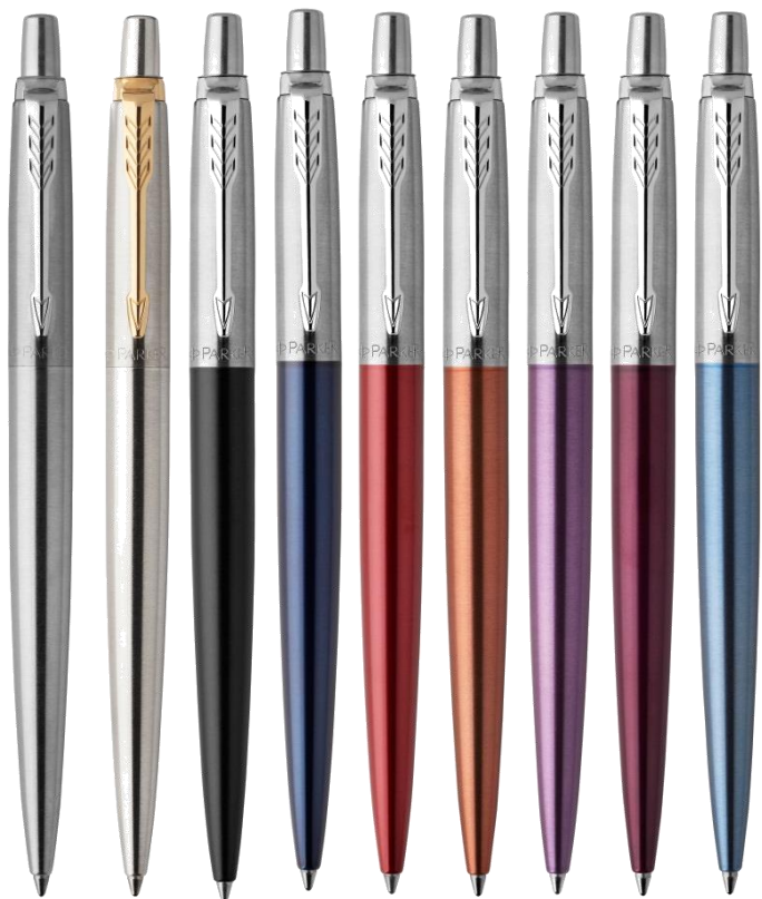
Базовый 9 отделок