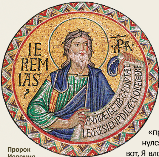
Пророк Иеремия (Италия, XII в.)