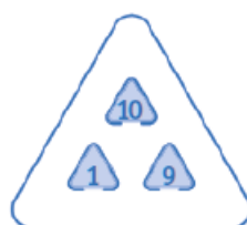
Или вы можете играть с любыми 3 числами

Примечание: Наибольшее число всегда помещается в верхней части треугольника. Это пространство обозначено красным на игровом поле.