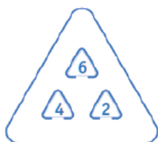
Карты на доске

Вот несколько примеров уравнений, которые вы можете сделать: