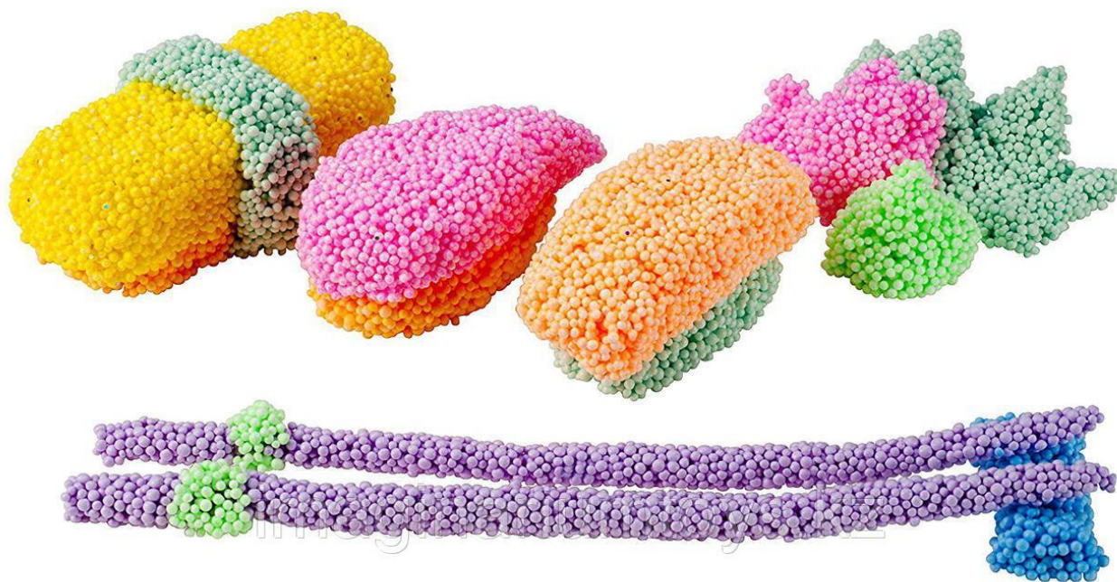
Роллы и суши