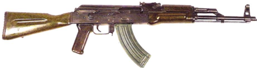
Рисунок 1 - Списанное оружие (охлажденное) – 7,62мм автомат Калашникова АКМ (модель ВПО-925)

Списанное оружие (охлажденное) – 7,62мм автомат Калашникова АКМ (модель ВПО-925), предназначено для использования в культурных и образовательных целях, в том числе с возможностью имитации выстрела из него патроном светозвукового (шумового) действия.