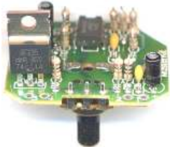
Рис. 1 Общий вид устройства

Повышенная частота регулирования полностью исключает мерцание видеозаписи и значительно снижает утомляемость глаз. Регулируя яркость переносной автомобильной лампы, можно установить необходимую освещенность во время ремонта (или отдыха) и уменьшить разряд аккумулятора.